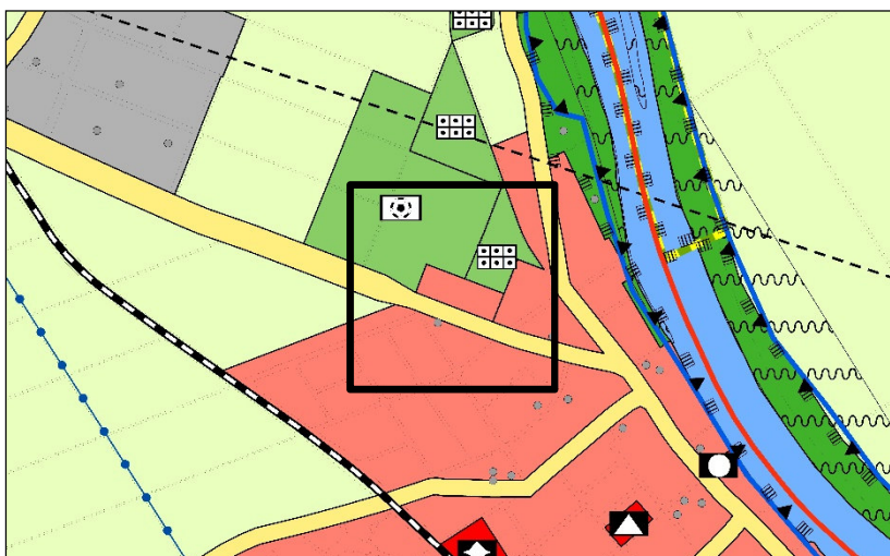
Darstellung des FNP nach Berichtigung